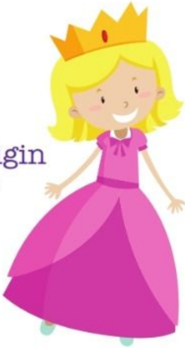
die Königin regina