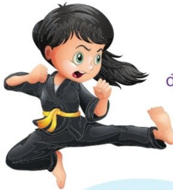
das Karate karate