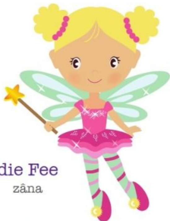
die Fee zâna