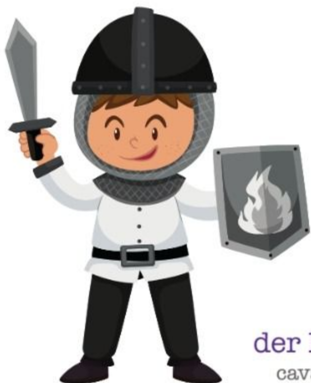
der Ritter cavalerul