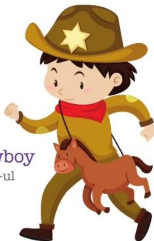
der Cowboy cowboy-ul