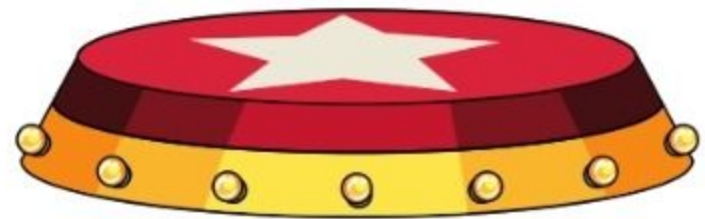
die Manege manejul, arena de circ