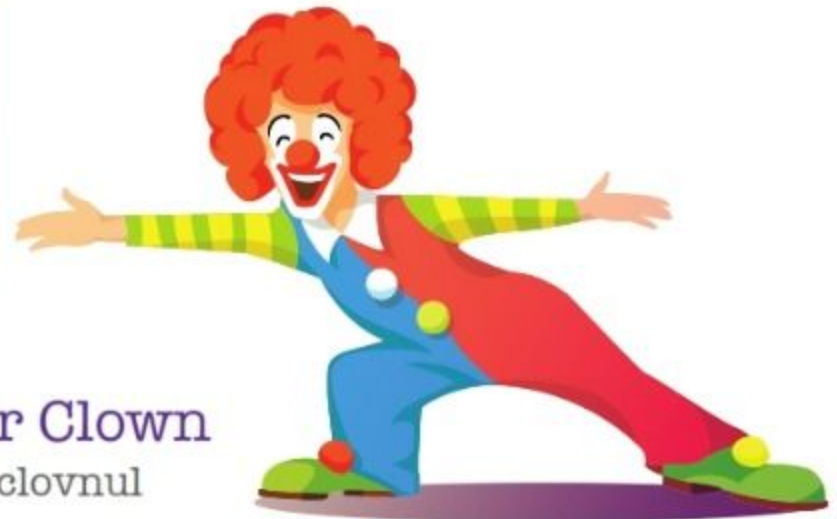
der Clown clownul