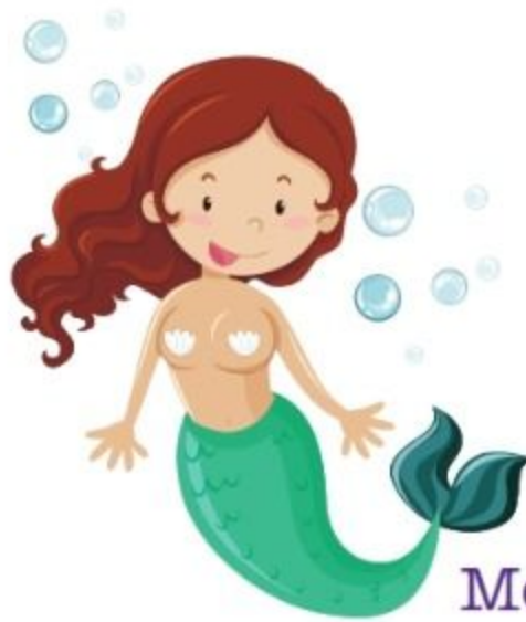
die Meerjungfrau sirena