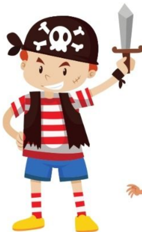
der Pirat piratul