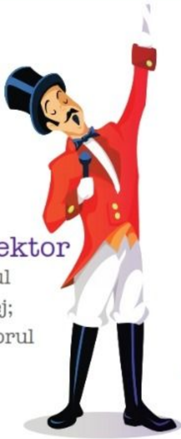
der Zirkusdirektor maestrul de manej; prezentatorul de circ