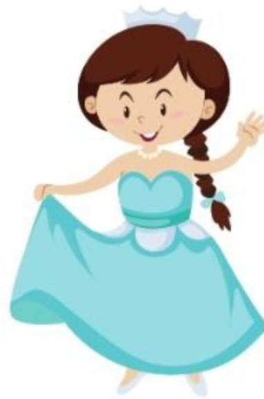
die Prinzessin prințesa