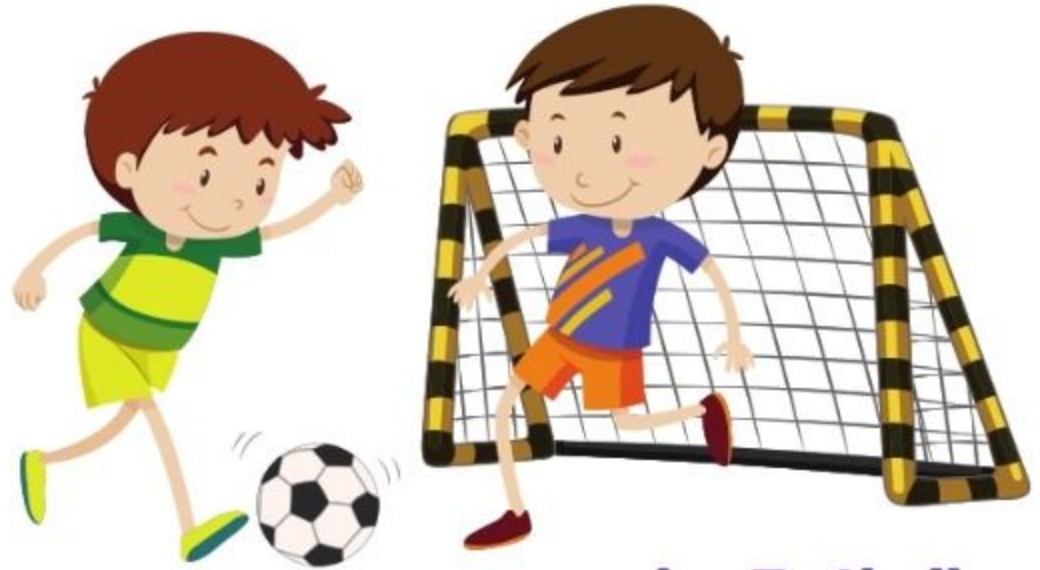
der Fußball fotbalul