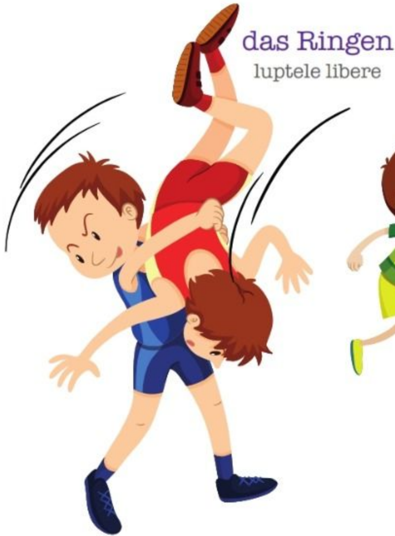
das Ringen luptele libere