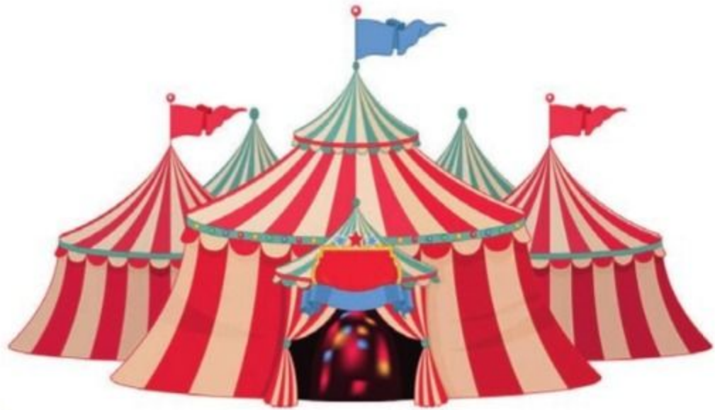
das Zirkuszelt cortul de circ