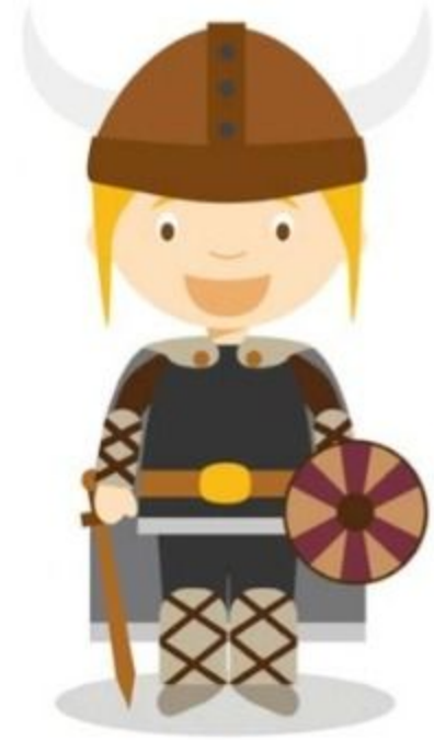
der Wikinger vikingul