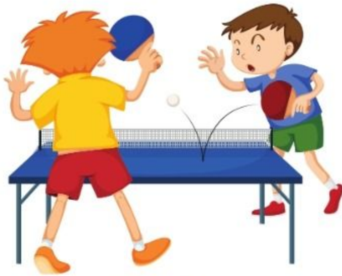
das Tischtennis ping-pongul, tenisul de masă