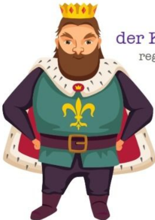
der König regele