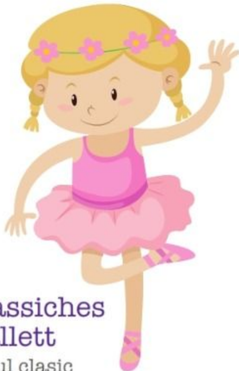
die klassisches Ballett baletul clasic