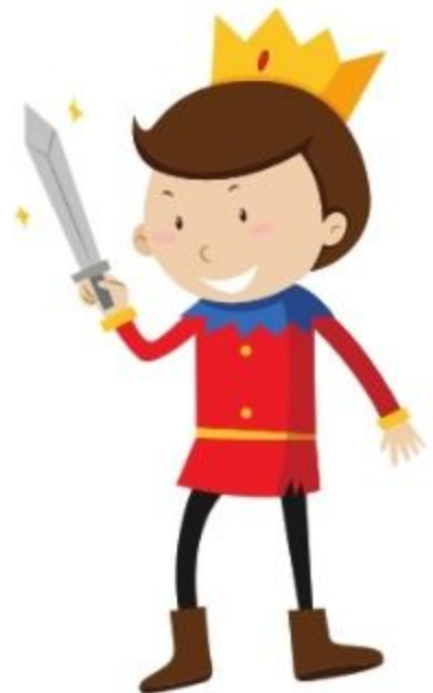
der Prinz prințul