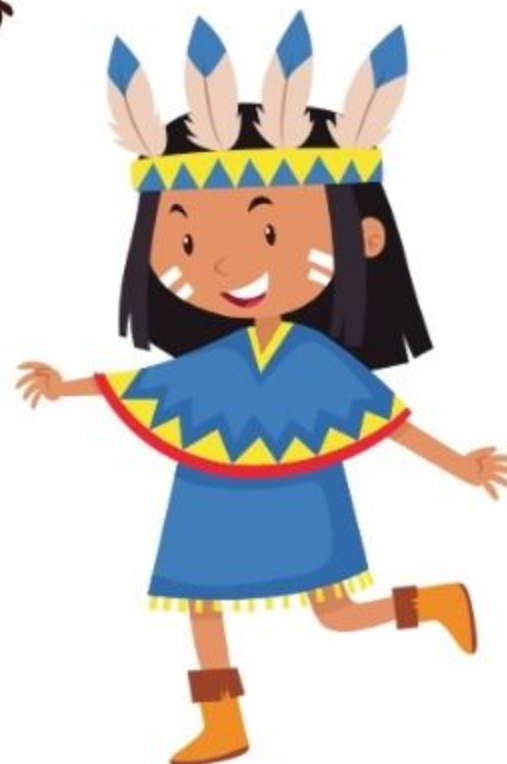
die Indianerin indianca